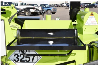
Laveste højde Største døre