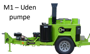
M1 – Uden pumpe

Omtanke for miljøet: Fugemaskinen er udstyret med en Tier IV-dieselmotor, der kører med lav omdrejningshastighed. Det gør den i stand til at holde et lavt brændstofniveau uden at gå på kompromis med den høje ydeevne. Den standard-monterede lyddæmper, kombineret med den valgfrie motorbeskyttelse, reducerer støjniveauet op til 40% sammenlignet med andre modeller.