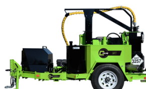
M1 – Med pumpe