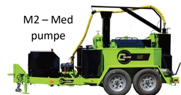
M2 – Med pumpe