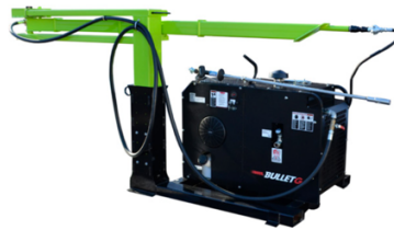
Valgfri X2 carry-on kompressor