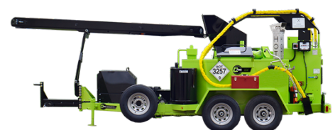
M4 – 2 slanger, 2 pumper & transportbånd