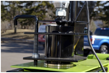
Slange ophængt på bom